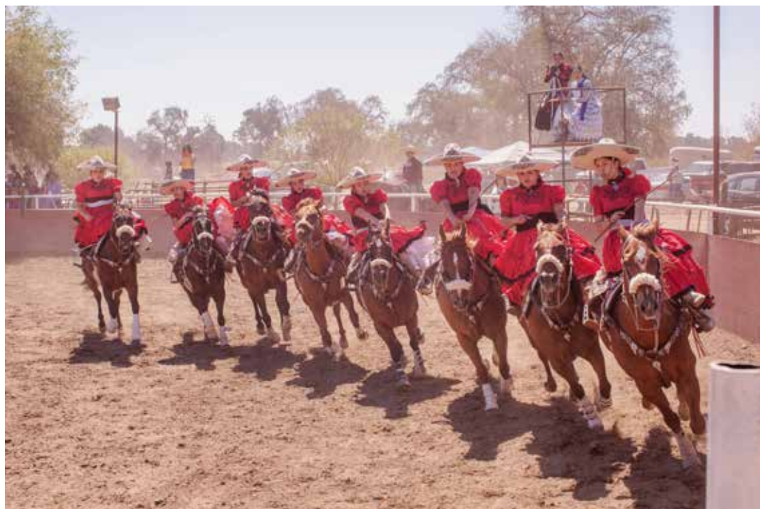
L'équipe Flor de Gardenia A s'est entraînée dès l'aube avant de se produire à midi sur le ring, exécutant notamment un « abanico » ou « éventail ».

L'« escaramuza charra » est la seule épreuve féminine des « charreadas », les démonstrations publiques de la « charrería » mexicaine. Cette compétition équestre traditionnelle proche du rodéo, inscrite au patrimoine culturel immatériel par l'Unesco, puise ses racines dans les techniques d'équitation des colons espagnols, les éleveurs de bétail indigènes y ayant ajouté un style unique. Vêtues de costumes colorés en hommage aux femmes de la révolution mexicaine, les « escaramuzas » montent en amazone et exécutent des figures précises, souvent à grande vitesse. Leurs prouesses sont indiscutées. Aux États-Unis, cette discipline est pratiquée par de nombreuses équipes d'Américano-Mexicaines qui vivent pleinement leur double identité. Un exemple de préservation culturelle qui défie les stéréotypes négatifs sur les immigrants d'Amérique latine de l'administration Trump.